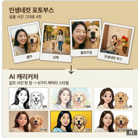
인생네컷(상)과 AI 캐리커처(하) — 같은 사진 한 장이 6가지 스타일로 (이미지: AI 생성)

핵심 메시지. 기존에 인기 있던 인생네컷 포토부스가 "사진 그대로의 순간"을 4컷에 담은다면, 위지스 AI 캐리커처는 "보호자와 반려동물을 6가지 캐릭터로 변환해 상상력 있는 한 컷"을 만듭니다. 인생네컷과 다른 새로운 결의 추억을 추가하는 부스입니다.