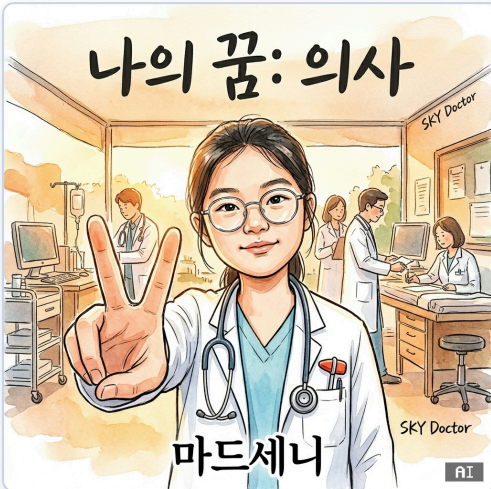
AI 생성 결과 — "나의 꿈: 의사"