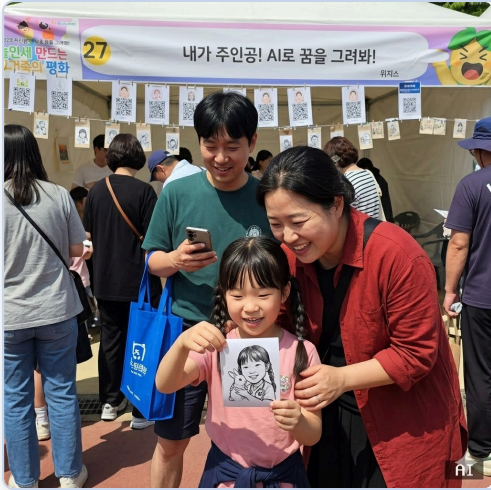
참가자 가족이 결과물 수령 (2026. 5. 5)