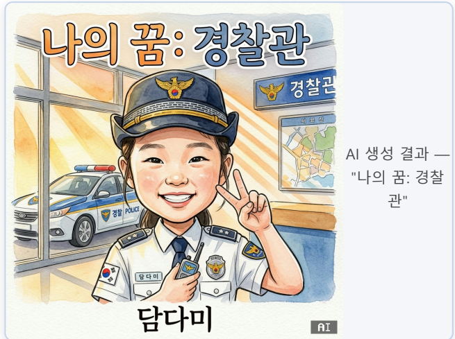
AI 생성 결과 — "나의 꿈: 경찰관"