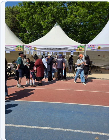
현장 운영 — AI 체험 부스