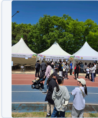
행사 현장 부스 운영