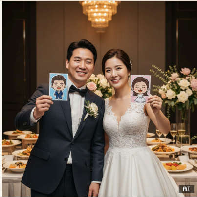
웨딩·기념일 뷔페 — 커플이 AI 캐리커처 인화 사진을 받고 기뻐하는 장면

아래 이미지는 AI로 생성한 출장 뷔페 + AI 캐리커처 서비스 연출 샘플입니다.