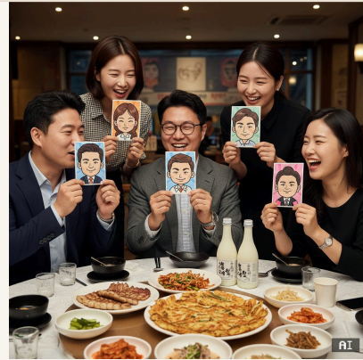
기업 연회·회식 뷔페 — 직장인들이 각자의 캐리커처를 비교하며 즐기는 장면