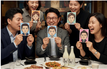
기업 연회·회식 뷔페