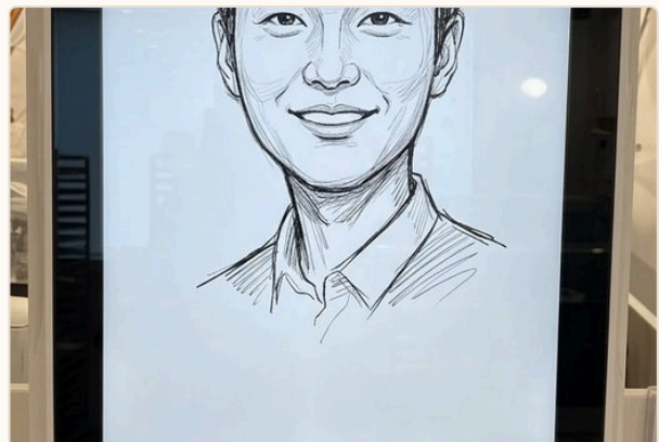
실제 운영 키오스크 — 스케치 초상화 스타일 화면