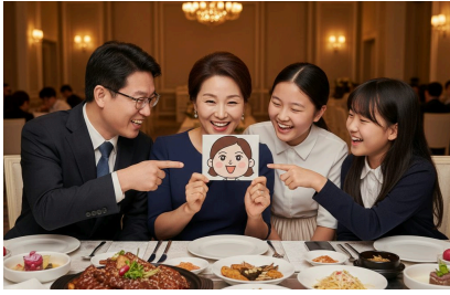
가족 뷔페 행사

아래 이미지는 모두 AI로 생성한 출장 뷔페 서비스 연출 컷입니다. 실제 행사에 적용될 AI 캐리커처 품질과 분위기를 미리 확인할 수 있습니다.