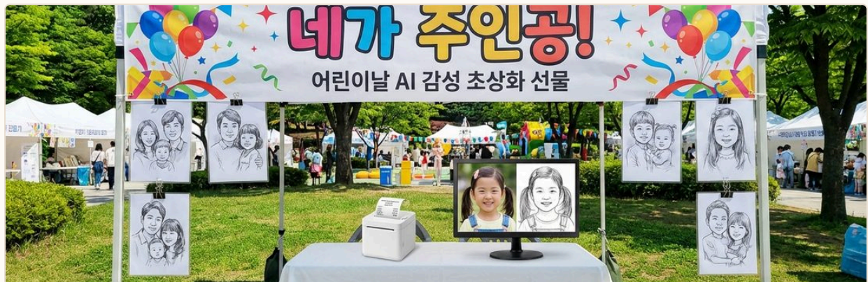
행사 부스 운영 전경 — 흑백 초상화 인쇄 결과물이 전시된 실제 현장