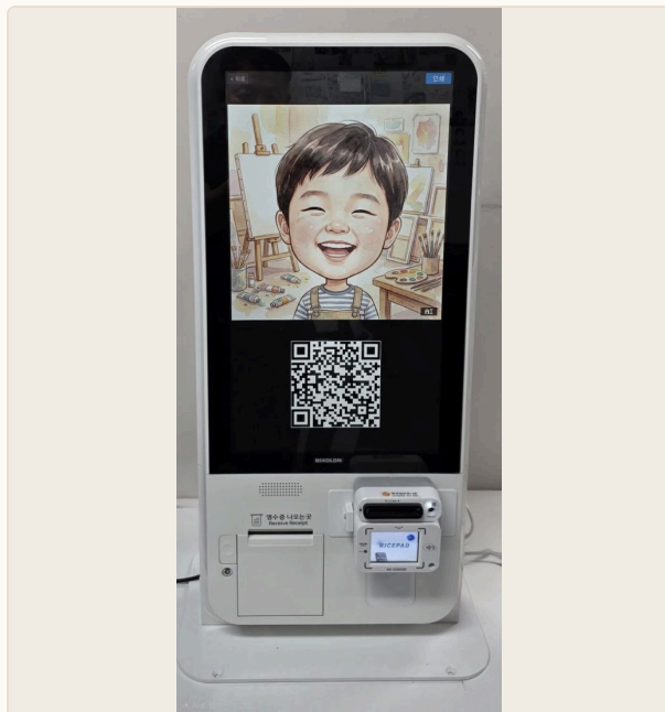
실제 운영 키오스크 — AI 캐리커처 화면 + QR 수령 안내