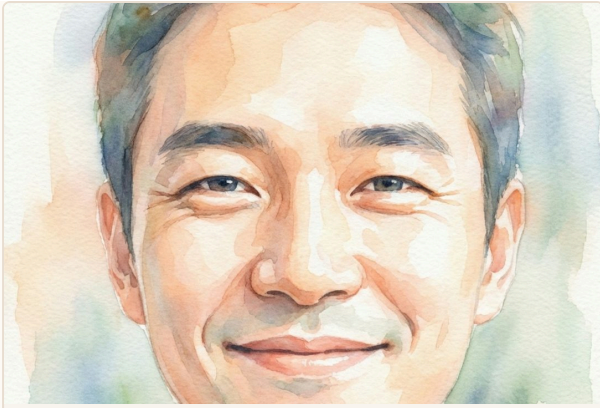
컬러 수채화 스타일 — 실제 AI 생성 결과물