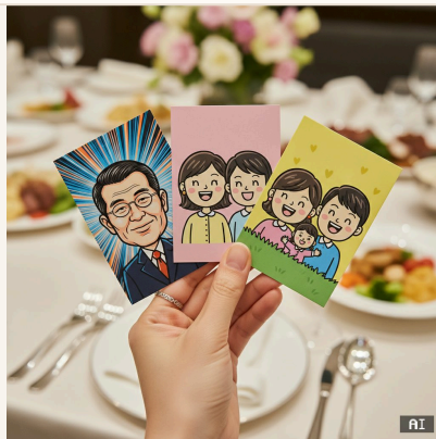
AI 캐리커처 컬러 인화 결과물 샘플 — 실제 현장에서 출력되는 형태