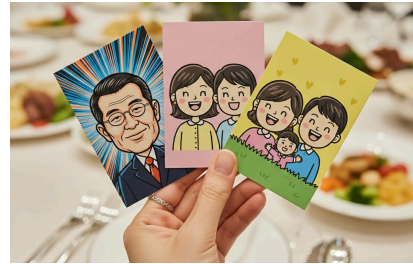
컬러 인화 결과물 샘플