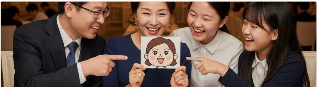
AI로 생성한 연출 이미지 — 출장 뷔페 현장에서 AI 캐리커처 인화 사진을 받고 즐거워하는 참여자들

하객이나 참여자가 식사 중 테이블 QR을 스캔하면 AI가 즉시 캐리커처를 생성합니다. 완성된 이미지는 현장에서 바로 컬러 인화해 수령 — 음식값 외에 특별한 기념을 선사하는 새로운 뷔페 차별화 서비스입니다.