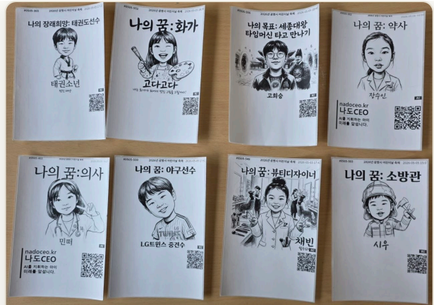
AI 캐리커처 실제 인쇄 결과물 8종 (당일 현장 출력)