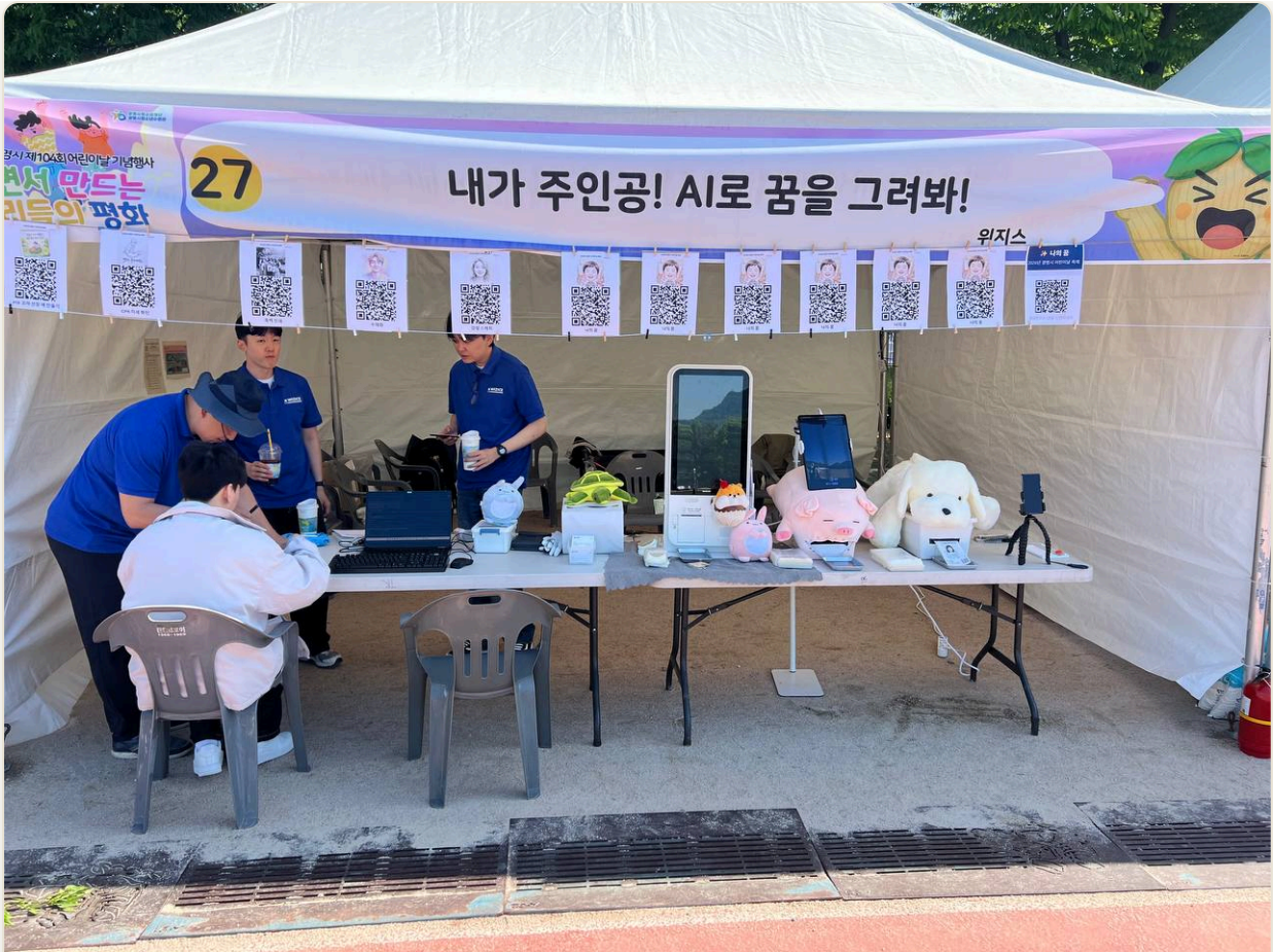
부스 전경 — "내가 주인공! 시로 꿈을 그려봐!" 현수막 · QR 가랜드 · 인쇄기 · 디스플레이 (2026. 5. 5)