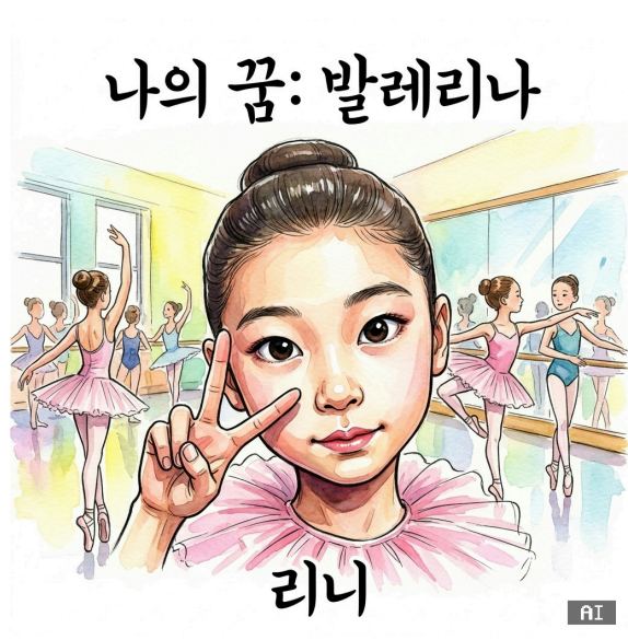
발레리나 무대 위 한 송이 꽃