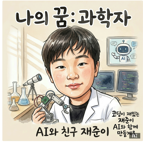
과학자 호기심으로 가득한 실험실