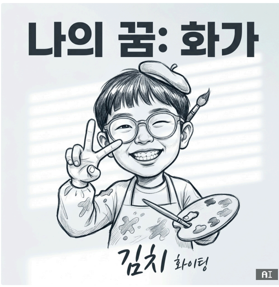
화가 캔버스 앞 작은 거장