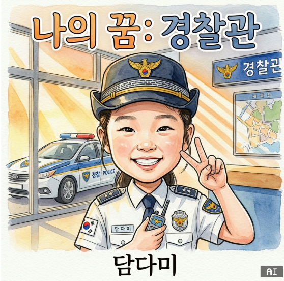
경찰관 우리 동네 지킴이