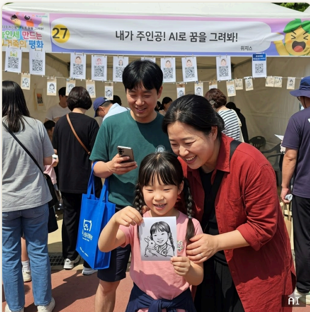
참가자 가족이 결과물 수령 — 즉석 인쇄 완료 (2026. 5. 5)