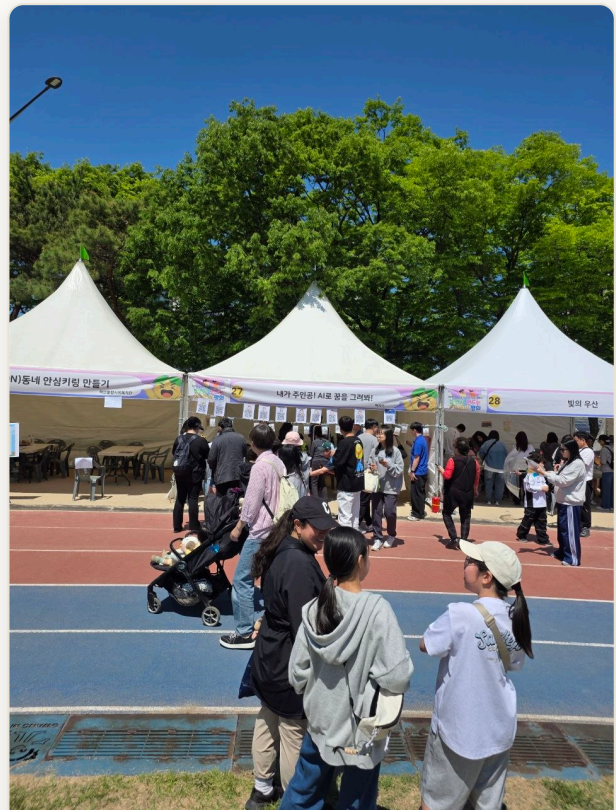
행사 현장 부스 운영 전경