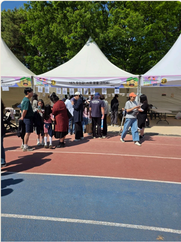
현장 운영 - AI 체험 부스